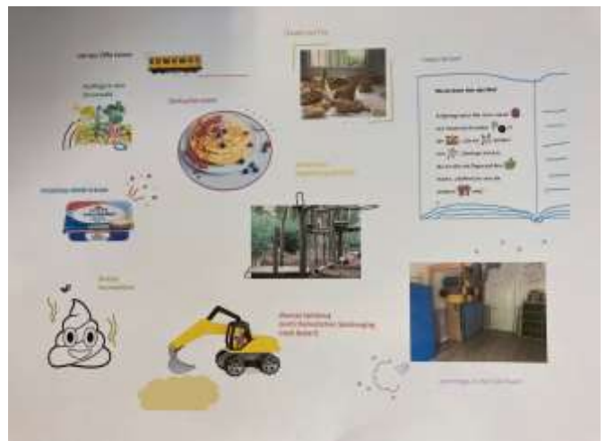
Relaisierte Kinderwünsche aus dem Havelsegler

Begonnen haben wir mit der Sprechstunde im Oktober 2023 und seitdem ist sie eine feste Instanz in unserer Kita. Jede Woche nehmen wir uns 30 Minuten exklusiv Zeit für die Anliegen zweier Kinder, sprechen anschließend in der Teamsitzung über die Themen und überlegen, wie wir die mutig vorgeschlagenen Ideen umsetzen und unterstützen können. Die Kinder lernen so, dass ihre Stimme zählt, sie wichtig ist und ernst genommen wird. Und die sonst so großen und abstrakten Begriffe von Partizipation und Teilhabe werden im Kleinen konkret erfahrbar. Das erste Kind hat fertig überlegt. „Ich möchte auf den Mond und dort auf einem Dinosaurier reiten und dann den Mond zusammendrücken und mitnehmen. Außerdem ist es mir zu laut in der Kita.“